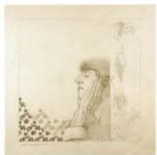
Estudio para Aubrey Vincent Beardsley. lápiz sobre papel. 50x50 cm. 2005.

Arquitecto y diseñador británico (1868-1928). Máximo exponente del Art Nouveau en Escocia. Comenzó sus estudios en la escuela de arte de Glasgow, completando su formación en Europa. A su regreso a Inglaterra, se incorporó al estudio Honeyman & Keppie y, poco después, funda el grupo The Four en Glasgow, con J. H. MacNair y las hermanas Frances y Margareth MacDonald, con quien contrajo matrimonio posteriormente. El grupo se dedicó en particular al diseño y la decoración de todo tipo de objetos (vidrio, carteles, yeso, metal) y se impuso rápidamente con su estilo abstracto y de gran pureza lineal.