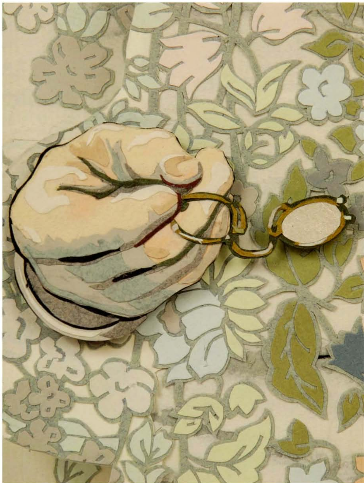
Sir Lawrence Alma-Tadema. Técnicas en papel, 52x52cm.2007.Detalle.