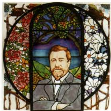
9 | Louis Comfort Tiffany técnicas en papel, 52x52cm. 2005.

Pintor holandés (1836-1912). Tras estudiar en Amberes, se establece en Londres en 1870. Se le puede considerar uno de los pintores más famosos del periodo victoriano tardío. De estilo realista y meticuloso, se especializó en la representación de escenas históricas, primero de la Edad Media y más tarde de la Antigüedad, cuando visitó los restos romanos de Pompeya. En 1873 se hizo súbdito británico y logró ser elegido miembro de la Real Academia (1879). Por como representaba el mármol se le llegó a llamar "the marbelous painter" ("el pintor marmolilloso" para evocar fonéticamente el adjetivo "maravilloso").