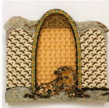
7 Antoni Gaudí i Cornet técnicas en papel, 52x52cm. 2007

Pintor y dibujante checo (1860-1939). Instalado en París, fue uno de los impulsores del art nouveau. Realizó carteles, estampas e ilustraciones, colaborando en L'illustration , Monde Illustré y otras publicaciones. Su salto a la fama lo logró con su primer cartel litográfico para la actriz Sarah Bernhardt y su Théâtre de la Renaissance , el cartel que anunciaba la obra, apareció en los primeros días de enero de 1895 en los muros de París, y causó una auténtica sensación. Tras retornar a su país en 1910, se dedicó a la pintura histórica.