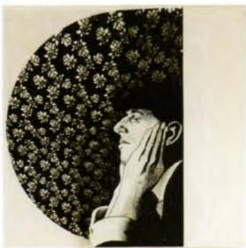
1 Aubrey Vincent Beardsley técnicas en papel, 52x52cm. 2005.

Ilustrador británico (1872-1898). Su interés por el dibujo se manifestó ya durante su infancia, pero no inició estudios de arte hasta los diecinueve años, en la Westminster School, al entablar relación con el pintor prerrafaelita sir Edward Burne-Jones. En 1894 fue nombrado ilustrador y redactor de la revista The Yellow Book y más tarde de The Savoy . Entre sus ilustraciones más famosas se encuentran la obra Salomé de Oscar Wilde (1894) y, por su erotismo más explícito, la Lisistrata de Aristófanes (1896). Inválido desde 1896, murió a la edad de veinticinco años.