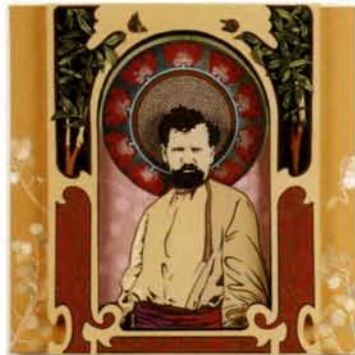
6 Alfons Maria Mucha técnicas en papel, 52x52cm. 2002.

Pintor y dibujante checo (1860-1939). Instalado en París, fue uno de los impulsores del art nouveau. Realizó carteles, estampas e ilustraciones, colaborando en L'illustration , Monde Illustré y otras publicaciones. Su salto a la fama lo logró con su primer cartel litográfico para la actriz Sarah Bernhardt y su Théâtre de la Renaissance , el cartel que anunciaba la obra, apareció en los primeros días de enero de 1895 en los muros de París, y causó una auténtica sensación. Tras retornar a su país en 1910, se dedicó a la pintura histórica.