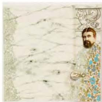
8 Sir Lawrence Alma-Tadema técnicas en papel, 52x52cm. 2007

Editor y coleccionista alemán (1961). Fundador y presidente de la editorial Taschen. Comenzó a los 12 años vendiendo cómics raros por correo, y a los 18 abrió su primera librería de cómics en Colonia. En 1983 cuando estuvo a punto de cerrar su tienda de cómics, con dinero de su familia acertó en comprar y revender 40 mil copias de un libro sobre Magritte impreso en inglés, que se remataba a un marco. De esa ganancia salió el primer libro de su editorial: una reedición de la obra de la fotógrafa Annie Leibovitz. Desde entonces comienza a editar libros de artistas, pintores, fotógrafos, arquitectos, directores. En 2004, su colección de arte privada, tuvo su propia muestra en el Museo Reina Sofía de Madrid.