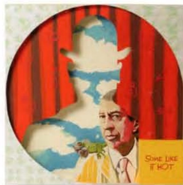
5 Benedikt Taschen técnicas en papel, 52x52cm. 2006.

Pintor austriaco (1862-1918). Fue la figura más representativa del modernismo pictórico (Jugendstil) en el mundo de habla alemana. Se formó en la Escuela de Artes Aplicadas de Viena y triunfó como autor de grandes pinturas decorativas en un estilo de corte academicista, del que constituyen un buen exponente las pinturas de la escalera del Museo de Historia del Arte de Viena. En 1897 su interés por el arte de vanguardia lo llevó a abandonar la Asociación de Artistas Vieneses y a fundar, con algunos amigos, la Secesión Vienesa, de la que fue el primer presidente y máximo exponente. Las pinturas murales alegóricas para la Universidad de Viena, suscitaron duras críticas y abandonó el encargo antes de finalizarlo.