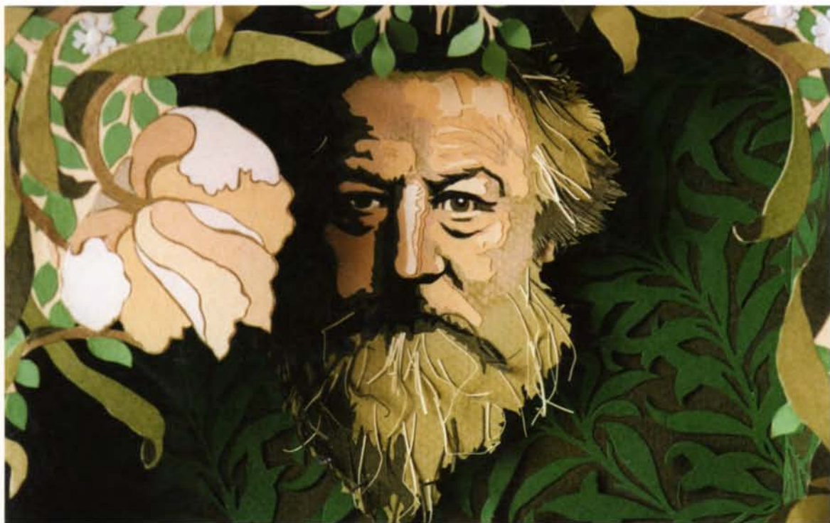
William Morris. Técnicas en papel, 52x52cm.2004.Detalle.

Mariano González nació en Buenos Aires, Argentina, en el año 1972. Se graduó de Maestro Nacional de Dibujo en la Escuela Nacional de Bellas Artes Manuel Belgrano y de Profesor de Pintura en la Escuela Nacional de Bellas Artes Prilidiano Pueyrredón.