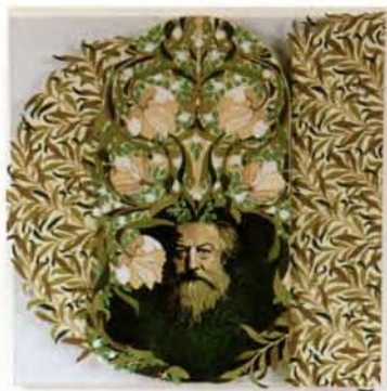
3 William Morris técnicas en papel, 52x52cm. 2004.

Escritor, pintor, diseñador y reformador social británico (1834-1896). Fundador del movimiento Arts and Crafts. Fue un socialista convencido, que intentó contribuir a la mejora de la situación de la clase obrera con distintas iniciativas y con su pertenencia a diversas asociaciones. Morris estuvo estrechamente vinculado a la Hermandad Prerrafaelita, movimiento que rechazaba la producción industrial en las artes decorativas y la arquitectura, y propugnaba un retorno a la artesanía medieval, considerando que los artesanos merecían el rango de artistas.