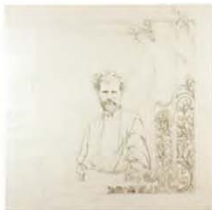
Estudio para Alfons Maria Mucha. lápiz sobre papel. 50x50 cm. 2002