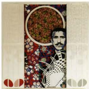
2 Charles Rennie Mackintosh técnicas en papel, 52x52cm. 2006.

Ilustrador británico (1872-1898). Su interés por el dibujo se manifestó ya durante su infancia, pero no inició estudios de arte hasta los diecinueve años, en la Westminster School, al entablar relación con el pintor prerrafaelita sir Edward Burne-Jones. En 1894 fue nombrado ilustrador y redactor de la revista The Yellow Book y más tarde de The Savoy . Entre sus ilustraciones más famosas se encuentran la obra Salomé de Oscar Wilde (1894) y, por su erotismo más explícito, la Lisistrata de Aristófanes (1896). Inválido desde 1896, murió a la edad de veinticinco años.