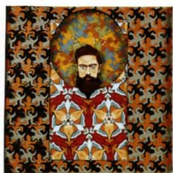
10 Maurits Cornelius Escher técnicas en papel, 52x52cm. 2002.

Decorador y vidriero estadounidense (1848-1933). Es el artista de Estados Unidos que más se asocia con el movimiento Art Nouveau. Hacia 1875 comenzó a interesarse en la técnica de elaboración de vidrio y trabajó en diversas vidrierías de Brooklyn. En 1885 funda la empresa elaboradora de vidrio Tiffany Glass Company, conocida desde 1900 como Tiffany Studios. Fue el inventor del "Avriile Glass" (vidrio irizado de fabricación artesanal), que empleó para decorar, con gran colorido, ventanas, jarrones, lámparas y otros objetos de arte decorativo. El uso de vidrio con color para la creación de vitrales fue motivado por los ideales del movimiento Arts and Crafts de Inglaterra.